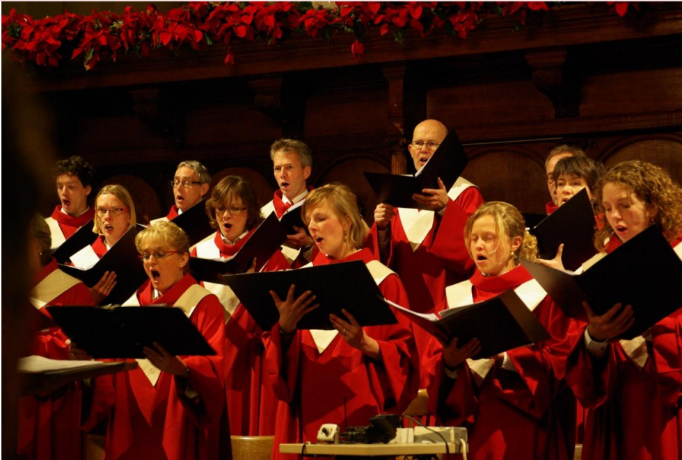
Het Adventsconcert in de Hooglandse Kerk : dit jaar 19 december