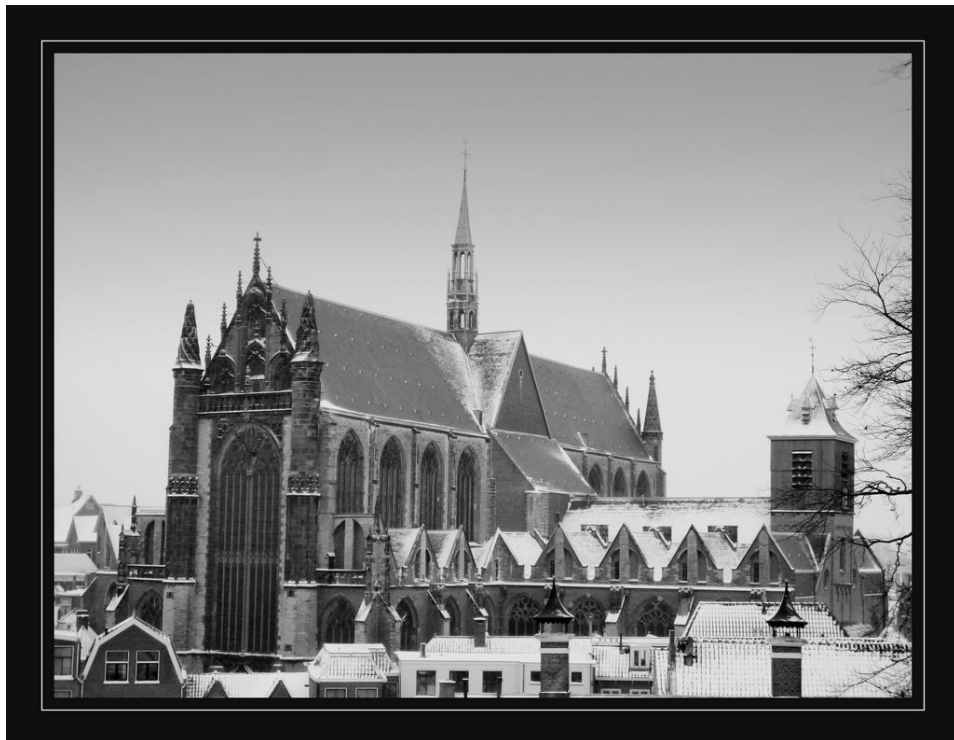
December 2009: de Hooglandse Kerk in de sneeuw

Leidse Cantorij Nieuwstraat 18 2312 KC Leiden ☎ 071-513 3509