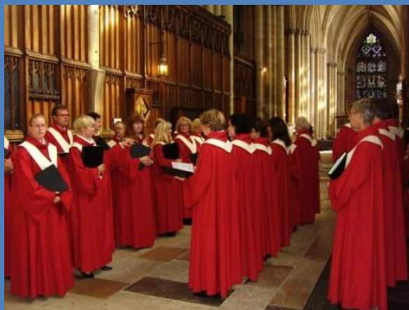
De Leidse Cantorij opgelijnd bij de aanvang van een evensong in York Minster in september 2006

Meer informatie op www.evensongsleiden.nl