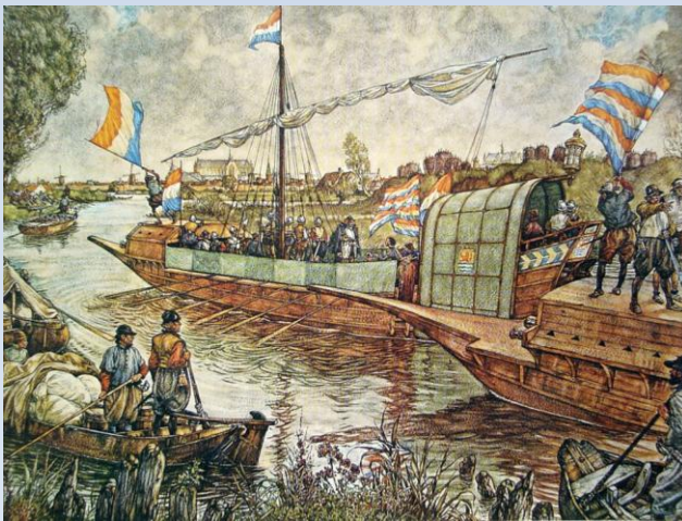
Deze bekende schoolplaat toont de trek van de Geuzen over de Vliet naar Leiden.